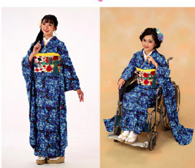
佐沼屋が制作したりんさんデザインの振袖

りんさんとの出会い 2年前の夏、岩手県一関市から1本の電話が佐沼屋に入った。「車椅子専用の振袖を見たのですね」。それが、三浦さん家族と佐沼屋の出会いのはじまり。佐沼屋が2年かけて開発・制作した車椅子専用の振袖を三浦さんがネット検索で発見したのがきっかけだった。 三浦さんご家族の強い希望により、住まいの