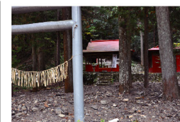
足环神社は足久保川に接し、駿河開発の拠点に

ご購入方法: ハガキ、ファックス、メール、または弊社ホームページのお問い合わせにて、下記①~⑤をお知らせください。なお発送の方は送料別途となります。 お申し込みお問い合わせ: 〒305-0854 茨城県つくば市上横場423-3 (株)プレステン 書籍係 電話 029-838-2366/FAX 029-838-2486