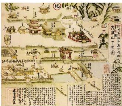
「常陸国筑波山下画図」宝暦5年(1755)時の筑波山中禅寺

拙著『日本のルーツ 筑波山』で、7代天神イザナギ・イザナミの「国生み・神生み」を西日本開発であるとした。私はオノコロシマを筑波山麓としており、国づくりの本拠地である条件として、人口や文化・産業などの高いレベルが必要であり、その条件を筑波山麓は満たしていた。私はイザナギ・イザナミの天地開闢を、考古学的視点などで4千年前と考えた。4千年前には、9割以上の人が東日本に集中しており、筑波山麓が日本の中心であったとする考えに妥当性が生まれる。その時期に縄文寒冷期と呼ばれる気候変動が発生、食料も安定し居住に最適であった東北地方(日高見国)の環境も激変している。そうした変化は、5900〜4200年前に存在していた三内丸山遺跡や多くの縄文遺跡から推測も可能であろう。 記紀などに登場する「国生み・神生み」神話では、登場する地域の殆どが西日本であり、その地の開発であったと考えることが自然だ。西日本を主基国と呼ぶのも鋤が土地開墾に使用される農具であり国名の由来とした。 ホツマツタエ以外の文献では、征服された地域として関東や東北地方が登場する。そこに縄文時代遺跡から判断する事実との矛盾が生まれている。少し前までの歴史書には、文化の遅れた異民族の存在が強調されていた。だが三内丸山遺跡などから考えると従来の認識と全く異なる日本の姿が見えてくるようだ。茨城県に生まれ育った一人として今回の神話物語では、民間の伝承行事などにも注視して精査したい。 歴史的に万葉集や常陸風土記に登場する筑波山は、神仏習合の聖地であり霊峰として崇められていた。そのため「筑波講・御六神講・大同講」と称される地域宗教行事があった。 講は筑波山頂に鎮座するイザナギ・イザナミの筑波山二社(男体山神社・女体山神社)や山中の稲村神社(アマテル)、渡神社(ヒルコ)、小原神社(ツキヨミ)、安座常神社(ソサノヲ)などを崇拝し、子孫繁栄や豊作そして健康の祈願が行われていた。そのため六所神社(六所皇大神宮)、知足院中禅寺(筑波山神社)の発行する神の依り代「御影」を受け取り儀式を催した。 こうした風習や神社参拝の歴史が不明確になった要因に、明治維新の政策である神仏分離と廃仏毀釈があるようだ。筑波地域の神社をめぐる政府の対応は結果として異常な文化破壊に繋がった。それまで神仏一体の宗教思想で歩み、現在の筑波山神社の地には、徳川幕府から手厚く庇護された筑波山知足院中禅寺があり、山麓に目を向ければ勅使来訪の格式を持ち徳川家光の奉納品などを有する六所神社が鎮座していた。 明治元年(1868)に中禅寺は廃寺になり、六所神社も明治41年(1908)に蚕影神社との合祀により廃社させられた。神武4年の創建とも伝わっており日本有数の古社だけに不思議である。勅使来訪や坂上田村麻呂が鳥居など奉納した歴史ある神社へのこうした行為からも、国家の意図を感じてしまう。(続く) 文/いいのみち